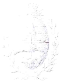
H. CAMARA DE SENADORES MENDOZA